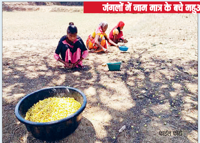
जंगलों में नाम मात्र के बचे महुआ के पेड़

ग्रीष्म ऋतु के इस सीजन में जिले का वनांचल इलाका महुआ की मादकता से दमक रहा है। वहीं फूलों से लदे बचे खुचे महुआ के पेड़ों को देख वनवासियों के चेहरों में भी चमक साफ दिखाई दे रही है और वे भोर फटने से पहले महुआ बीनने सपरिवार पेड़ों के नीचे पहुंच रहे हैं। उल्लेखनीय है कि वनवासियों की आय का प्रमुख स्रोत मानी जाने वाली महुआ की फसल इन दिनों जंगल में तैयार हो चुकी है। फसल हाथ से न निकल जाए इस बात का ख्याल रखते हुए वनवासी भोर फटने के साथ ही पेड़ों के नीचे पहुंच जाते हैं और सूरज निकलने के साथ ही उनकी टोकरीयां महुआ के फलों से लबालब भर जाती हैं। यहां बताना लाजमी होगा कि वनवासियों के लिए महुआ की फसल आय का एक प्रमुख जरिया है।