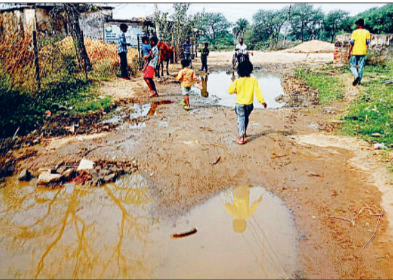
यह पानी सड़क में एकत्र हो रहा है। लगातार सड़क में जलभराव होने से अब यहां तालनुमा गहरा गड्ढा हो

विकासखण्ड पंडरिया के ग्राम बसनी से सेमरकोना जाने वाले मुख्यमंत्री सड़क मार्ग में जल भराव की गंभीर समस्या क्षेत्र के ग्रामीण परेशान और हलाकान है। लेकिन दर्जनों शिकायत शिकायत के बाद भी उनकी समस्या को कोई समाधान नहीं की जा रहा है। जिसे लेकर ग्रामीणों में भारी नाराजगी व्याप्त है। दरअसल स्थानीय ग्रामीणों की माने तो ग्राम सेमरकोना बस्ती में सड़क के पास एक वर्षों पुराना हैण्ड पंप है। जिसमें लम्बे समय से पानी निकल रहा है और